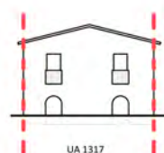
Via XX Settembre