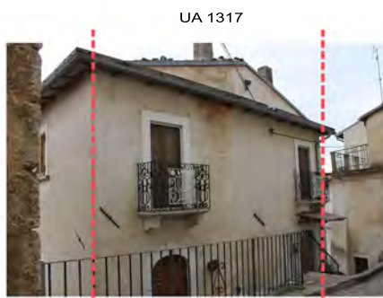
Via XX Settembre